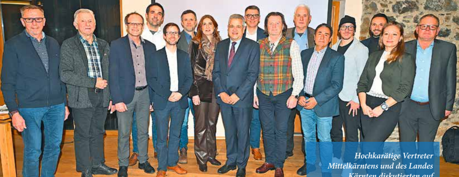
Hochkarätige Vertreter Mittelkärntens und des Landes Kärnten diskutierten auf Burg Taggenbrunn die Zukunftsthemen Mittelkärntens.