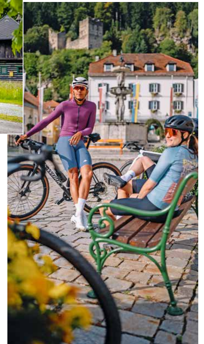
Gravel-Stopp in Friesach

Mit der „Kärnten Seen-Schleife-Challenge“ erhält eine etablierte Radroute ein sportliches Upgrade – unter der Federführung von Mittelkärnten und in Kooperation mit zwei weiteren Regionen. Dabei setzt man bewusst auf eine bereits bestehende Stärke: Die Kärnten-Seen-Schleife ist seit Jahren als beliebte Radroute etabliert und verbindet auf rund 430 Kilometern zahlreiche Seen und Landschaftsräume im Süden Österreichs. Neu ist nun die gezielte Inszenierung dieser Strecke als sportliche Herausforderung für Rennrad- und Gravelbike-Fans. Die Challenge transformiert die bekannte Route in ein strukturiertes Erlebnisformat, das Leistung, Etappenplanung und touristisches Angebot miteinander verknüpft. Damit wird aus einer klassischen Radroute ein modernes Produkt für den aktiven Urlaub. Umgesetzt wird das Projekt in Zusammenarbeit mit den Regionen Wörthersee-Rosental und Nassfeld-Lesachtal-Weissensee, während Mittelkärnten die inhaltliche und strategische Leitung übernimmt. „Die Kooperation zeigt, wie