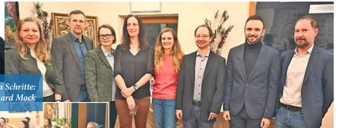
Geballtes Know-how auf einen Blick: Das kompetente Team des Regionalmanagements Mittelkärnten fungiert als Navigator für alle regionalen Belange.