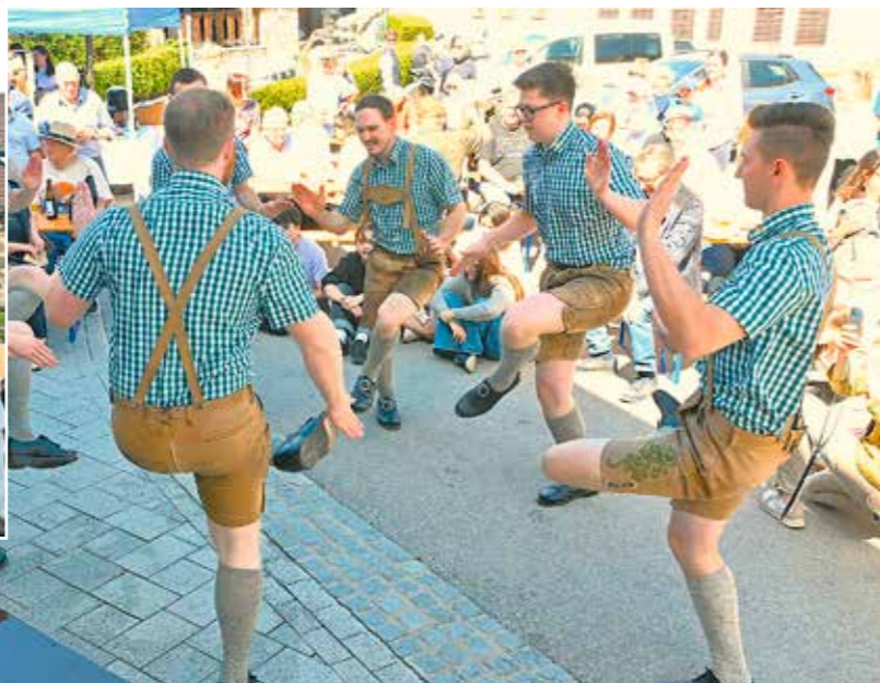
Hochleistung: die Mirniger Schuhplattler