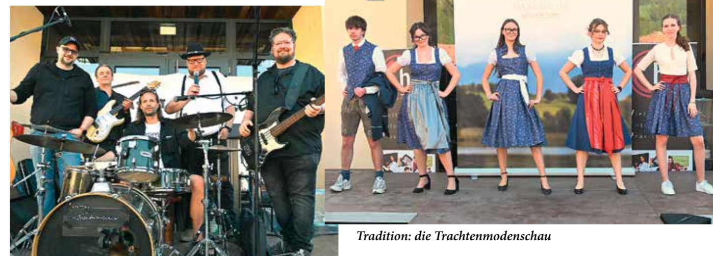
Tradition: die Trachtenmodenschau