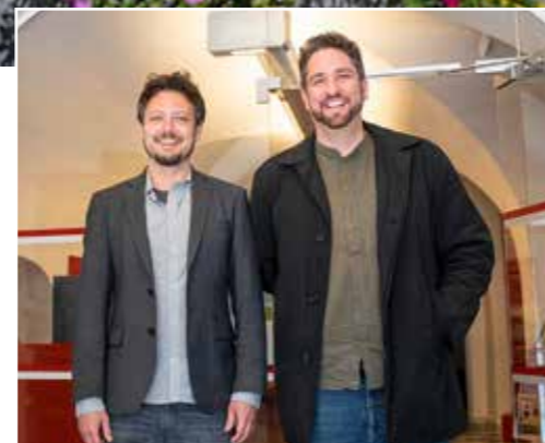
Die Museumsleitung des Museums St. Veit