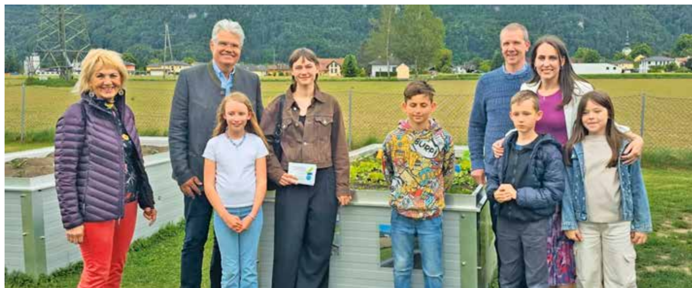
Im eigenen Wurmkomposter wird Kompost für die Hochbeete erzeugt.