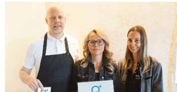
Gasthof Schumi, St. Georgen am Längsee

Der familiengeführte Forellenzentrum Bacher liegt idyllisch auf rund 1.000 Metern Seehöhe am Fuße der Saulalpe und verbindet naturnahe Erholung mit herzlicher Gastfreundschaft. Kulinarisch überzeugt der Betrieb vor allem mit frischen Forellengerichten aus dem hauseigenen Fischteich, die für regionale Qualität und authentischen Geschmack stehen.