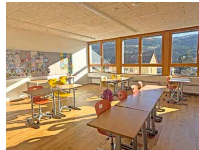
Im Gurktal konnte nach langem Hin und Her ein Bildungszentrum entstehen, das in lichtdurchfluteten Räumen modernen und zeitgemäßen Unterricht ermöglicht.