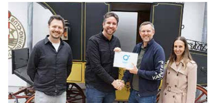
Museum St. Veit

Der familiär geführte Landgasthof Schumi verbindet gemütliche Unterkunft mit regionaler Küche und legt besonderen Wert auf frische, saisonale Zutaten. Gäste schätzen die herzliche Atmosphäre ebenso wie die qualitativ hochwertigen, frisch zubereiteten Speisen und die persönliche Betreuung vor Ort.