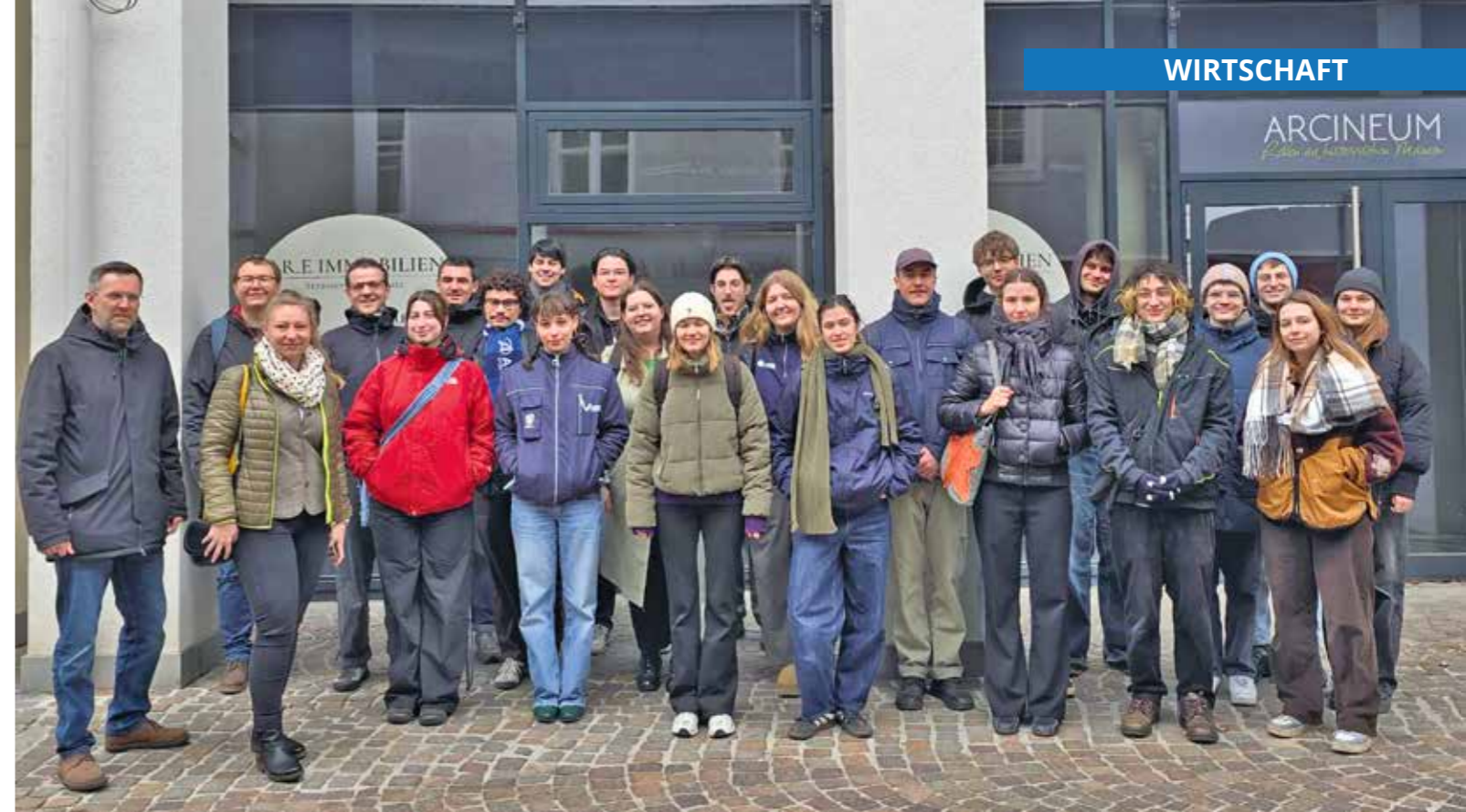
Die Studierenden der Universität Wien präsentierten ihre Forschungsergebnisse in Althofen