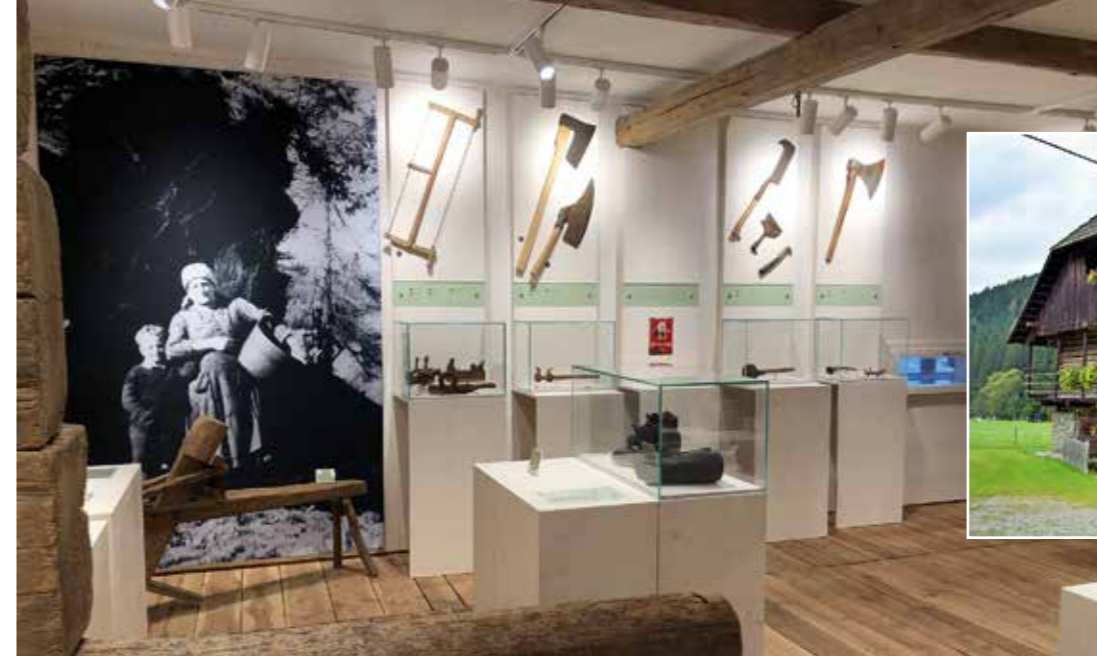
Das Museumsprogramm ist aufbauend auf den volkskundlichen und naturkundlichen Sammlungsbestand interdisziplinär ausgerichtet. © Stefan Walcher ausDRUCKSvoll (2)