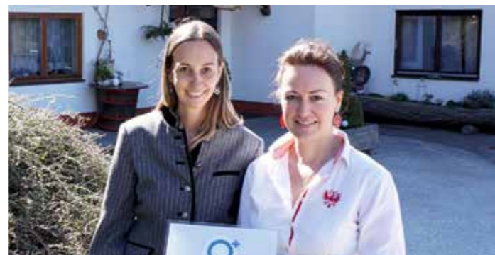
Forellenzentrum Bacher, Kirchberg

Das Museum in der historischen Altstadt von Althofen widmet sich dem Leben und Wirken des Erfinders Carl Auer von Welsbach und zeigt weltweit einzigartige Exponate wie frühe Metallfadenlampen und Gasglühlichtsysteme. Besonderes Highlight ist das original erhaltene Laboratorium, das einen authentischen Einblick in die Arbeitsweise eines der bedeutendsten österreichischen Wissenschaftler bietet.