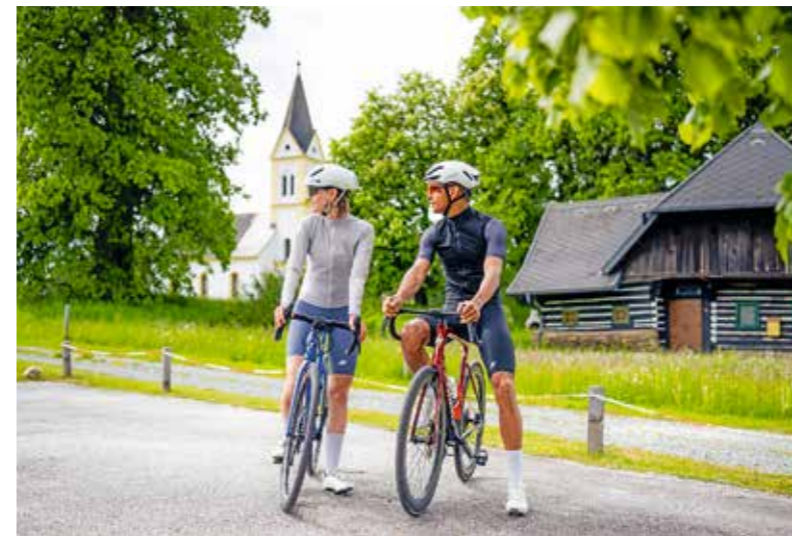
Berg-Etappe auf den Kraigerberg

Die insgesamt 24 Routen für Gäste und natürlich auch alle Kärntner Gravel Fans erstrecken sich über beeindruckende 1800 Kilometer und bieten für jede Leistungsklasse die passende Herausforderung. Von gemütlichen Touren bis hin zu anspruchsvollen Strecken – Gravel Carinthia spricht sowohl Einsteiger als auch erfahrene Gravel-Biker an. In Mittelkärnten sind die Touren vor allem im Wimitzgraben, rund um die Simonhöhe aber auch im ehemaligen Bergbaugebiet zwischen Friesach und Guttaring angesiedelt. Alle Routen sind miteinander verbunden und starten sowie enden an