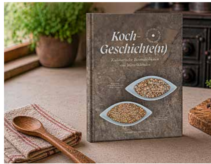
Das Kochbuch entstand im Rahmen des Projekts „Kultur-Vielfalt Mittelkärnten“ mit Unterstützung der Orts- und Regionalentwicklung der Kärntner Landesregierung (Abteilung 10).

Bei uns gibt es viele landwirtschaftliche Betriebe sowie Produzenten und Veredler, die hochwertige Lebensmittel herstellen. Diese sind die Grundlage für unseren täglichen Speiseplan.