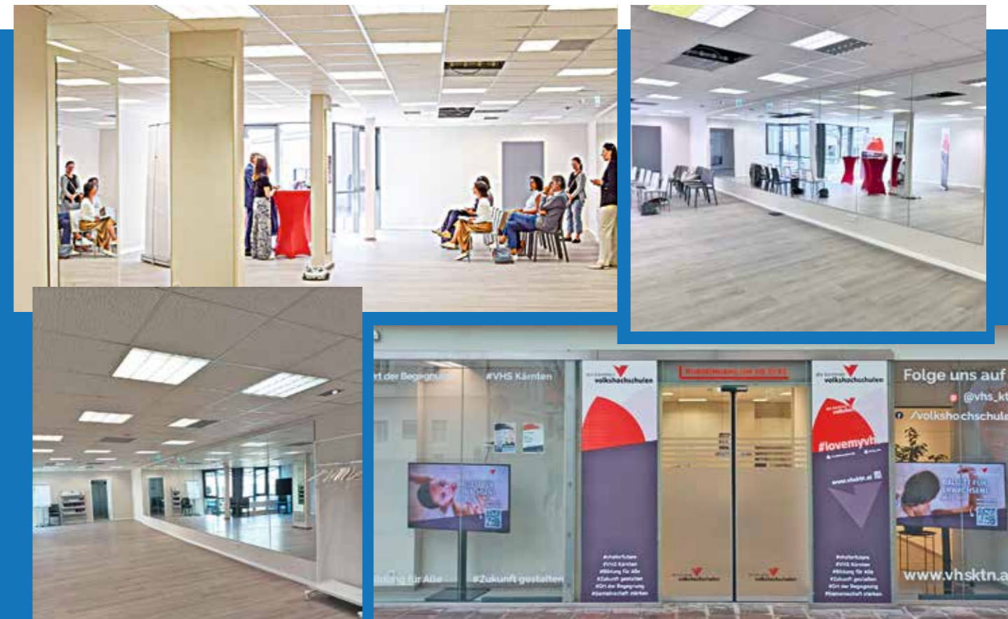
Bewegungsraum der VHS St. Veit