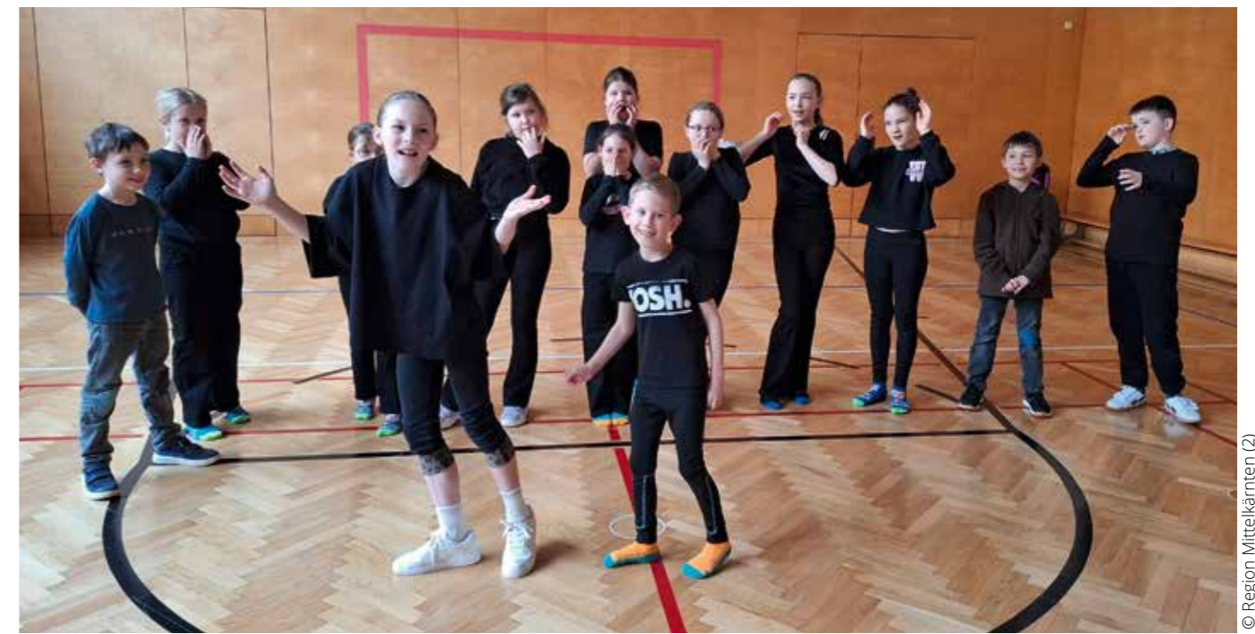
Workshop in den Osterferien 2026 in Maria Saal

LAND KÄRNTEN Abt. 10 – Land- und Forstwirtschaft, Ländlicher Raum